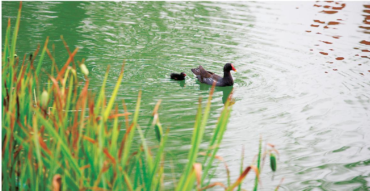
多年不见的野鸭又游回如意湖。

一套治污组合拳打下来卓有成效。如今的如意湖,岸芷汀兰,郁郁青青,鱼儿欢跃,水鸟翔集,以前村民对