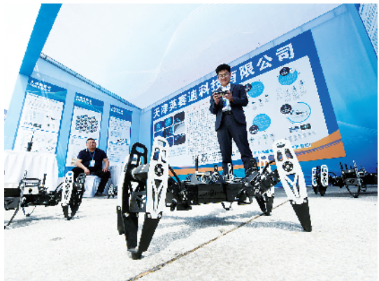
参展商家在介绍产品。

这是一次春天的相见,播下希望,也种下信任。此刻,春意盎然的沙颍河两岸,春潮澎湃的三川大地已经张开了双臂,拥抱着周商周才,共同感受着周口经济腾飞的和煦春风。②22