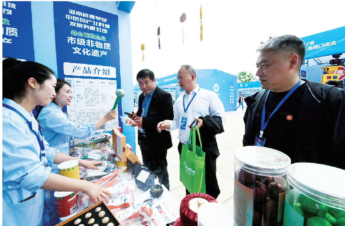
嘉宾在了解河南省豫草堂中医药产业科技发展有限公司的产品。

值得关注的是,本届大会还举办了周商周才科技创新成果展示及合作交流对接活动,展示周商周才新质生产力企业科技创新产品和科研成果。②22