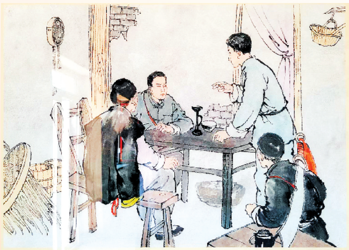
(美术作品)理琪在文登沟于家村研究开展武装斗争 摄于山东文登天福山起义纪念馆