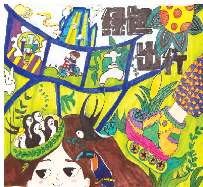
小记者：师畅优 云南师范大学附属小学 呈贡校区五（3）班