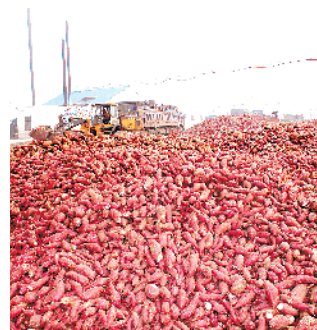
汲冢镇新天豫食品公司院内大量待加工红薯