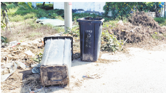
淮阳区刘振屯乡科教路西段多处垃圾桶旁有散落垃圾秸秆和废弃物