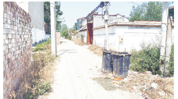
淮阳区刘振屯乡西头县道 015 旁边有一处残垣断壁,大量建筑垃圾、秸秆和废弃物