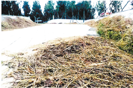
川汇区金海路办事处银珠路小学南道路上有多处秸秆堆积