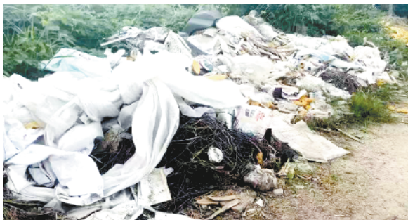
川汇区华耀城办事处周口大道和北环路交叉口东北角有大片生活垃圾和杂物堆积且有刺鼻气味