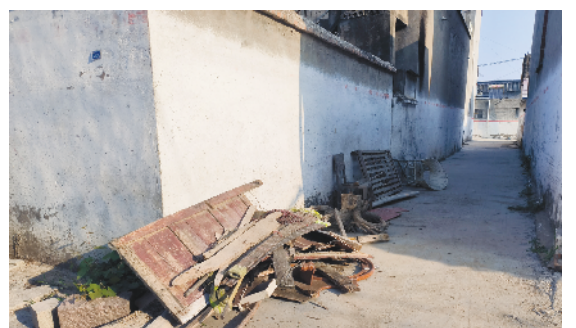
淮阳区柳湖办事处李营子行政村小张庄村村内乱堆乱放现象严重