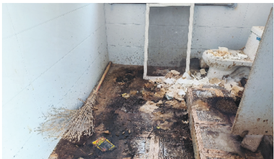
淮阳区柳湖办事处棠棣村村民文化广场内公共厕所脏乱不堪,不能正常使用