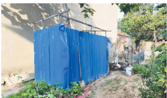
淮阳区柳湖办事处左桥行政村刘庄村设有户外简易旱厕,旁边养殖鸡鸭,环境差