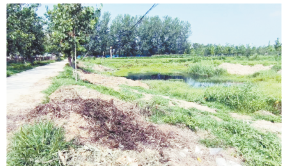
淮阳区刘振屯乡赵腰庄村东头坑塘边有大量生活垃圾、秸秆