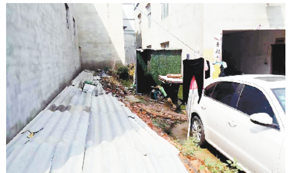
川汇区华耀城办事处后孙庄村室外存有旱厕