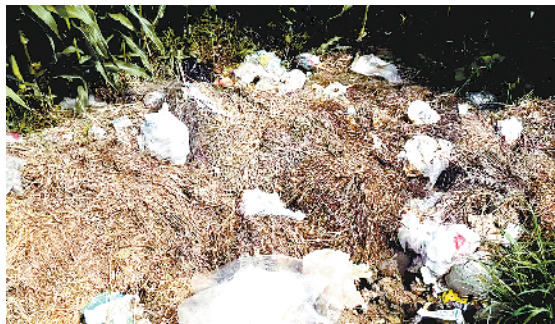
川汇区华耀城办事处后孙庄村入村水泥路旁有机秆和杂物堆积