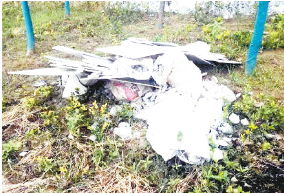
川汇区金海路办事处周套楼村内有机秆和杂物散落