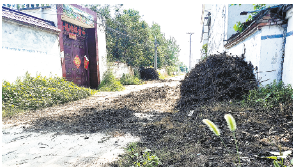
淮阳区刘振屯乡熊楼寨村乱堆乱放现象严重,秸秆随意堆积