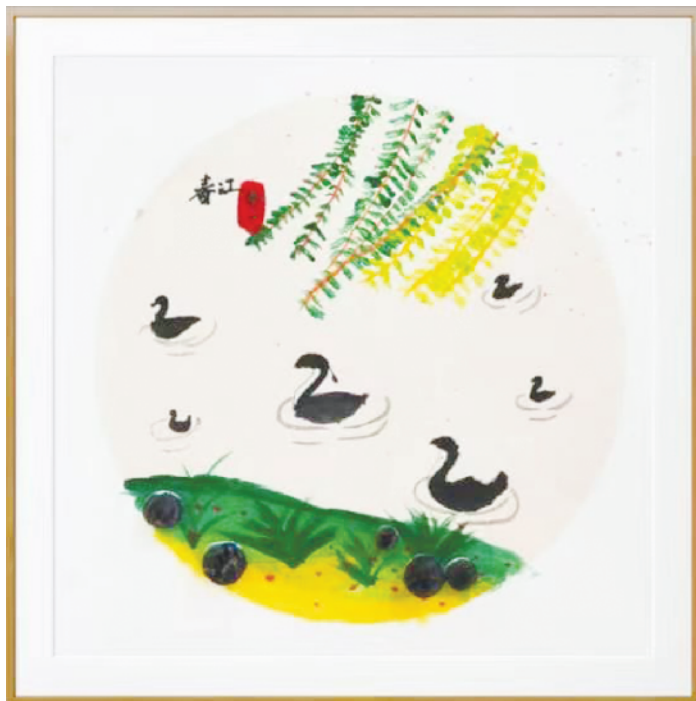
小记者:史韩一 证号:222038 周口中原路小学二(4)班