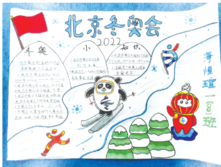
小记者:海恒璋 证号:220685 周口闫庄小学一(8)班 (辅导老师:马娜娜)