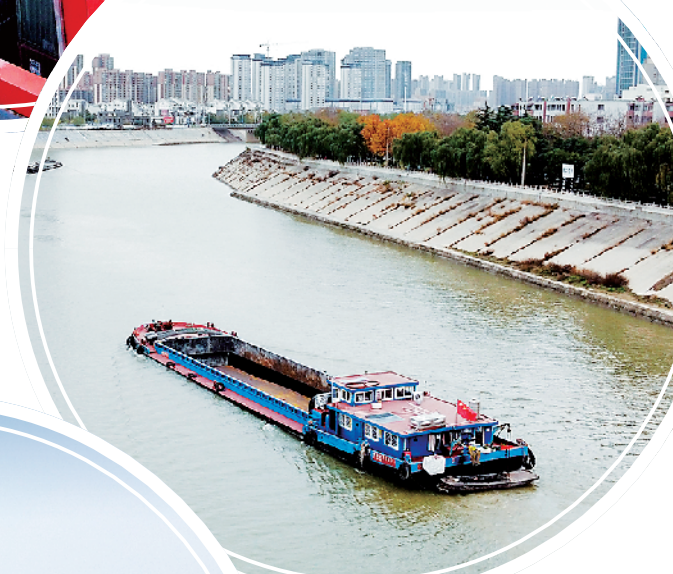
繁忙的沙颍河已成为“黄金水道”。