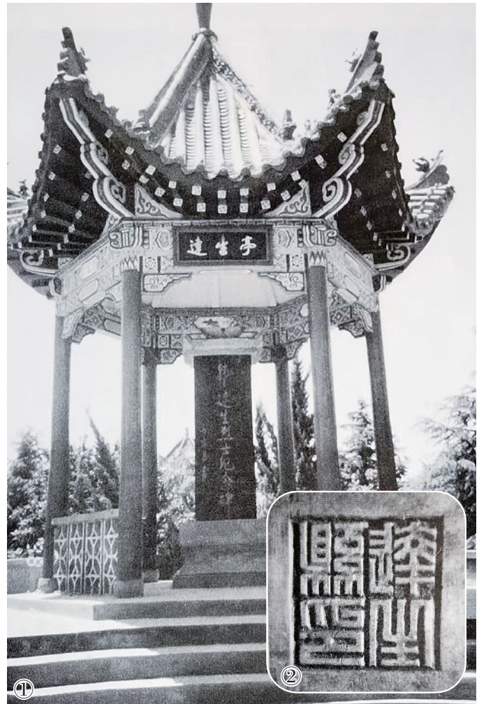
图①为杞县水东烈士陵园内的韩达生烈士纪念碑。

交通员沉着冷静,安排说跟着他走、见机行事。进到房间,日寇盘问、搜查几遍,还单独吓唬几个孩子。