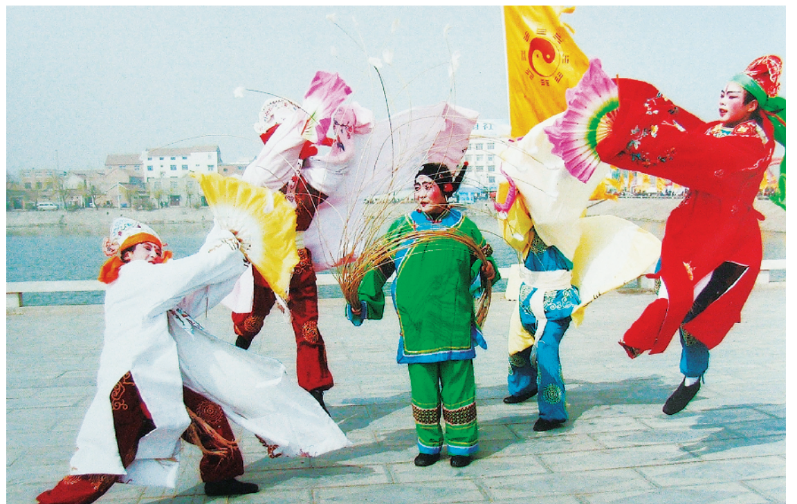
扑蝶舞演出现场。(资料图)

我国的民间舞蹈中,扑蝶舞独树一帜,它是古代寺院艺术在民间流传后融入社会的典范;它反对封建礼教、冲破宗教禁锢、歌颂爱情的内容,为大众喜闻乐见;它的舞蹈动作独特、舞蹈技巧娴熟、舞蹈语言丰富,具有较高的艺术价值;它活态传承、创新提高,经久不衰,对研究鄂、豫民间舞蹈的起源、传承、发展有着重要意义,将进一步丰富、完善中国民间舞蹈史。②8