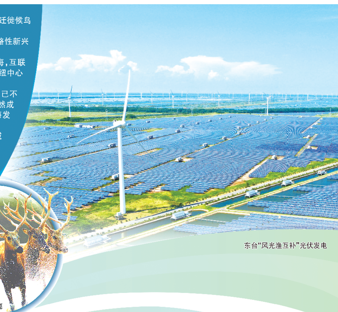
东台“风光渔互补”光伏发电