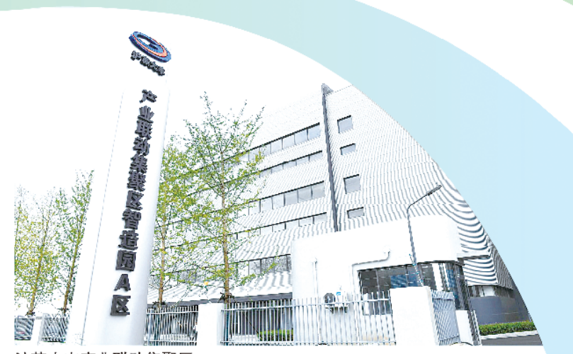
沪苏大丰产业联动集聚区

2022年9月26日,来自卡塔尔的“阿尔卡莎米亚”号液化天然气(LNG)运输船经过16天、6000海里的航行,抵达山海油盐城“绿能港”。作为中国在建规模最大的液化天然气储备基地,中国海油盐城“绿能港”建成后将成为华东地区重要的能源保供基地。