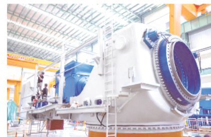
上海电气项目生产车间

日前,盐城新能源产业已集聚国家能源、华电、国电投等资源开发型重点央企和金风、远景、上海电气等风电、光伏装备制造龙头企业。全市新能源产业规模已超千亿,建有全球单体规模最大的滩涂风光电产业基地。全市新能源发电装机容量1273.7万千瓦,其中海上风电装机容量554万千瓦,约占全国20%,是名副其实的“海上风电第一城”,盐城已成为长三角首个“千万千瓦新能源发电城市”。