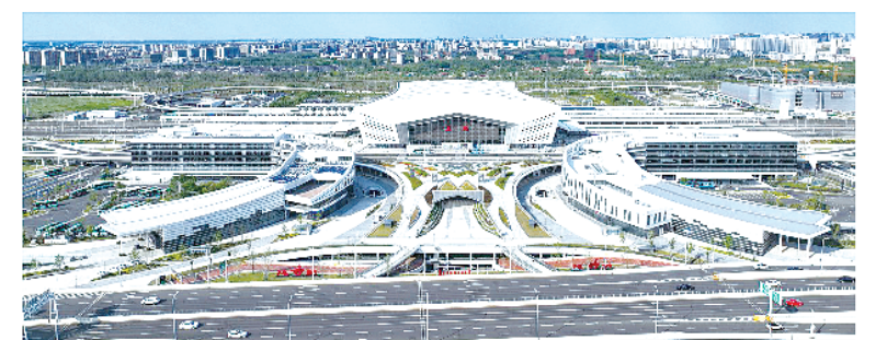
盐城综合客运枢纽

交通,是一座城市的血液,是城市发展的动力,也是城市发展的命脉。它串连着城市的发展脉络,牵引着城市未来的发展方向。