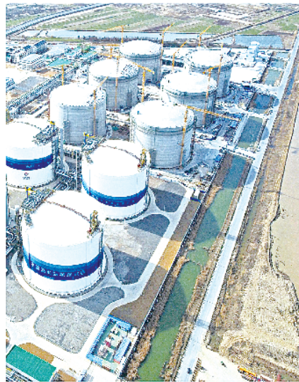
中国海油盐城“绿能港”

作为苏北唯一被纳入长三角中心区的城市,顺应中国式现代化要求,盐城在一体化发展的时代大潮中始终接轨上海、融入长三角作为发展重大战略,聚焦新能源汽车及核心零部件、新能源、新一代信息技术、新材料、人健康和数字经济、海洋经济,加快构建“5+2”战略性新兴产业和23