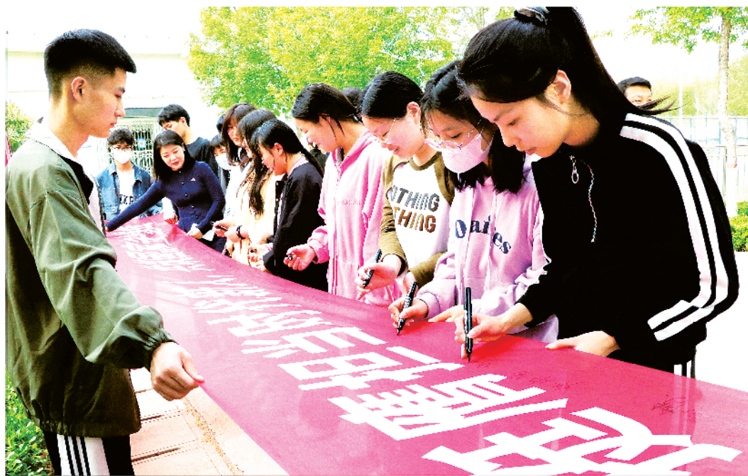
第八个“全民国家安全教育日”来临之际，4月13日，周口文理职业学院制作国家安全教育宣传展板、举办书画展、开展维护国家安全签名活动，组织广大师生积极参与，营造了浓厚的宣传教育氛围。

一季度，企业中长期贷款增势强劲。据了解，中国人民银行周口市中心支行先后会同市农业农村局、市文化广电和旅游局组织召开金融支持全市种业发展座谈会、金融支持全市文旅企业座谈会，联合市发改委等部门向各金融机构发送“省市重点项目、制造业中长期项目、专精特新项目”三项清单，促进银企密切合作。中国建设银行周口分行瞄准重点项目、设备更新改造、“保交楼”等领域，累计投放贷款超100亿元。周口农商行系统打造农村产业经营、农村物流体系建设、农村基础设施建设、脱贫攻坚“四大农字号”信贷体系，累计放款超160亿元。一季度，企业贷款新增72.8亿元，同比增长19.38%，高于各项贷款增速3.72个百分点，其中企业短期贷款同比增长4.1%，是自2022年以来首次实现正增长；企业中长期贷款同比增长24.1%，增速创两年以来新高，金融支持经济的稳定性增强。②15