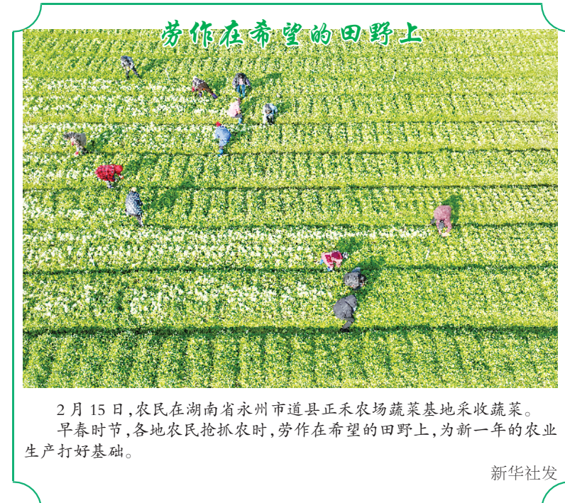
2月15日,农民在湖南省永州市道县正禾农场蔬菜基地采收蔬菜。早春时节,各地农民抢抓农时,劳作在希望的田野上,为新一年的农业生产打好基础。

读懂今天的中国,必须读懂中国共产党。该书英文版的出版发行,为国外读者了解中国共产党的历史提供了权威读本,对于向国际社会讲好中国共产党的故事,加强对中国共产党历史的宣传阐释,帮助国外民众认识到中国共产党真正为中国人民谋幸福、为中华民族谋复兴而奋斗,了解中国共产党为什么能、马克思主义为什么行、中国特色社会主义为什么好,具有重要意义。