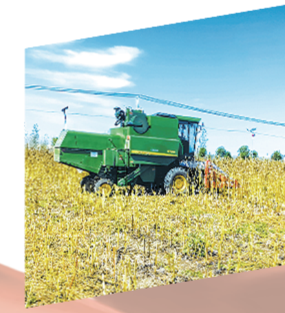
农机收获麻品种在项城市李寨镇白芝麻现代产业园试种成功