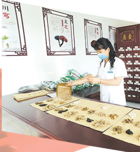
老百姓在家门口就能吃到北京同仁堂药店配制的中药