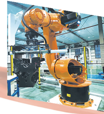
嘉友机械建造项目