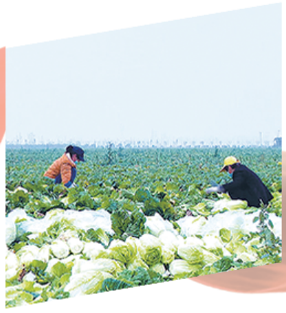
扶沟梁岗乡东营村农民在抢抓秋收

创新服务模式,推广应用政务服务“豫事办”“周口通”,实现更多民生服务事项掌上办、随身办。“豫事办”周口分行上线事项144个,注册用户达到634万。