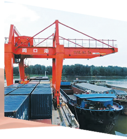
停泊在周口港的货船