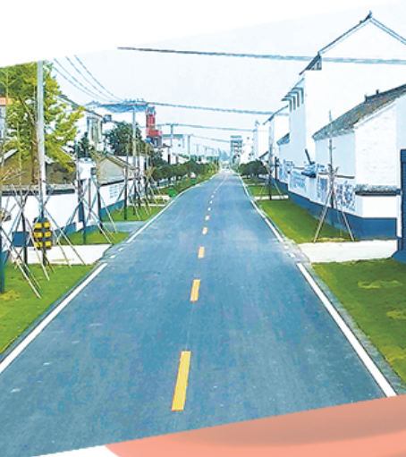
淮阳王楼村整理的村貌

今日周口,起帆风正劲!一份经济社会高质量发展答卷,谱写出新时代中原更加出彩绚丽篇章!