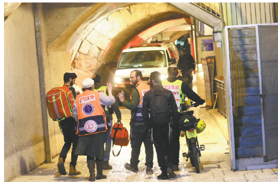
以色列警方在耶路撒冷老城打死一名巴勒斯坦人 3月7日,以色列医护人员在耶路撒冷老城事发现场工作。以色列警方7日发表声明说,一名巴勒斯坦人当天在耶路撒冷老城持刀袭击以色列警察,随后被开枪打死。

阿塞拜疆代表不结盟运动,委内瑞拉、伊朗、埃及、阿根廷、马来西亚、越南、柬埔寨、塞拉利昂、布隆迪等发言欢迎人权理事会举行此次会议,强调各国尤其是发展中国家人权受到新冠疫情严重影响,妇女、儿童、残疾人、老年人、土著人等弱势群体的权利面临严峻挑战,呼吁国际社会向发展中国家提供技术援助和能力建设,切实保障弱势群体权利。